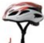
J galea protectória