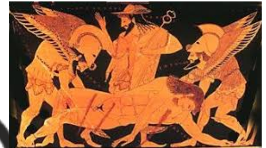
La mort de Sarpédon