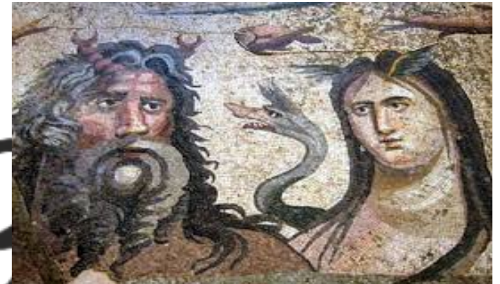
Le fleuve Scamandre