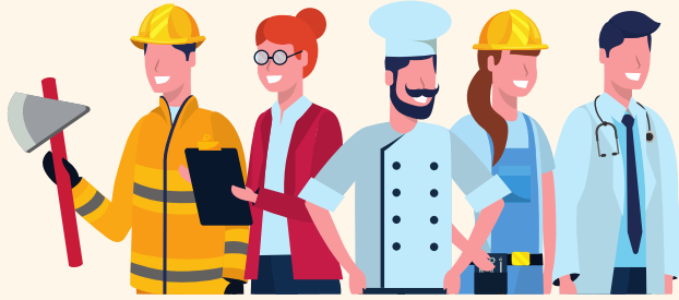
Les fonctions sont les "métiers" des mots

Dans le GN : la fonction épithète désigne la relation entre l'adjectif et le nom tandis que la fonction complément du nom désigne la relation entre le GNP et le nom dont il est complément.