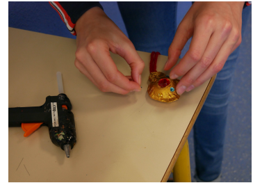
Décorer avec les gommettes autocollantes