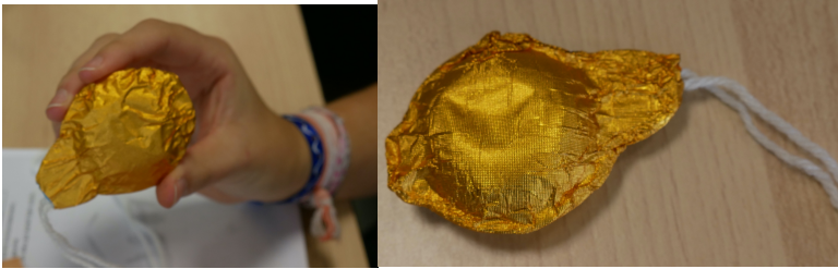
Le résultat obtenu