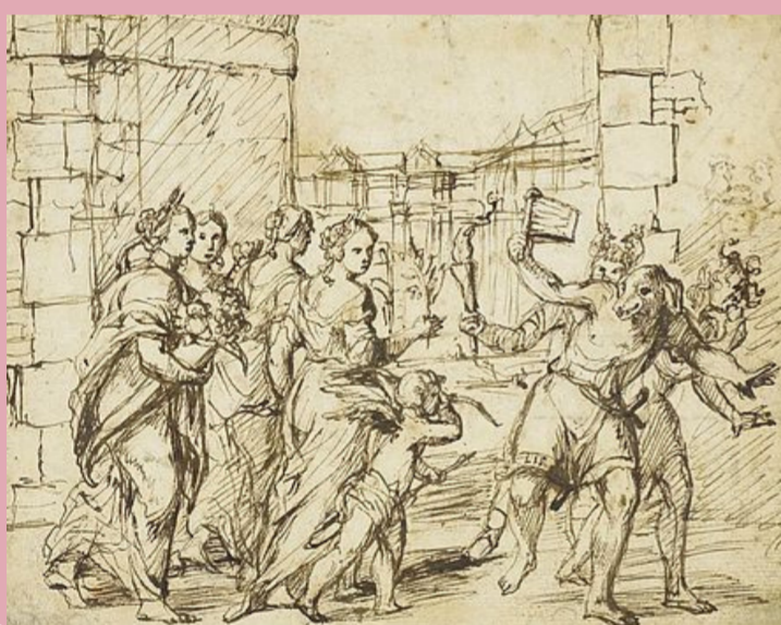
Le Festival lupercalien à Rome (vers 1578-1610), dessin du cercle d'Adam Elsheimer, montrant les Lupérques déguisés en chiens et chèvres, avec Cupidon et des personnifications de la fertilité

En 494, le pape Gélase Ier interdit cette fête païenne qui était toujours pratiquée, mais sans sacrifices rituels. Pour faire cesser cette pratique populaire, il écrivit une lettre à tous les chrétiens. Il choisit saint Valentin comme saint patron des fiancés et des amoureux, et décréta que cette date, le 14 février, lui serait consacrée. Depuis, nous fêtons la Saint Valentin.