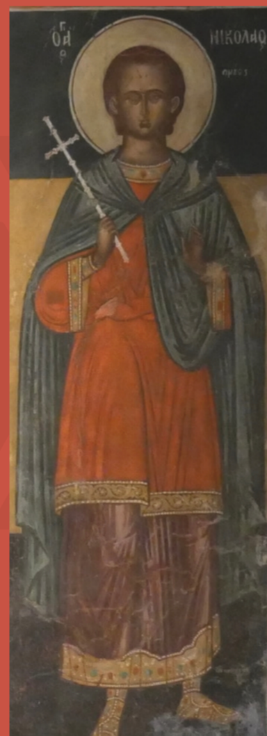
Le "vrai" Saint Nicolas, icône de l'église Saint Luc en Grèce

Le jour des Saturnales tout le monde se coiffait du pileus ( bonnet en feutre des esclaves affranchis ). C'est de là que vient la tradition du bonnet de Noël. On s'envoyait des présents et on offrait de somptueux repas. On s'offrait les fruits d'hiver ; des pommes, des oranges... et on décorait les seuls arbres restés verts, les sapins, avec des guirlandes et des bougies. C'est de là que vient la tradition des boules de Noël multicolores et des sapins décorés !