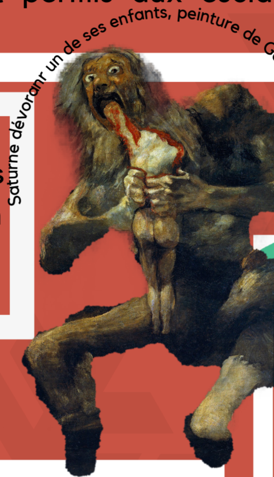
Saturne dévorant un de ses enfants, peinture de Goya, Musée du Prado

Les Romains disaient qu'anciennement on sacrifiait réellement à Saturne des victimes humaines, en particulier des enfants ; à son retour des douze travaux, Hercule interdit cet usage barbare.